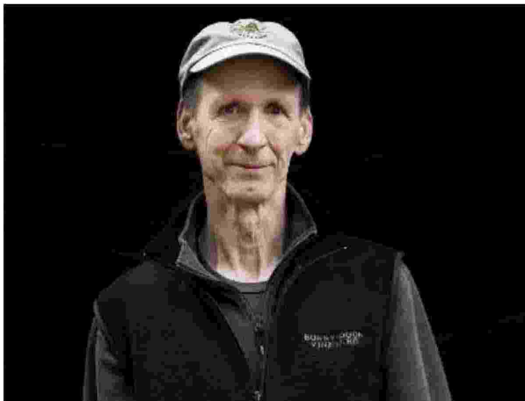
L'americano James Clifford è uno dei più autorevoli antropologi contemporanei